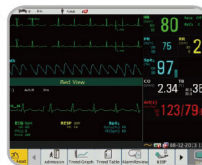
Vue du lit