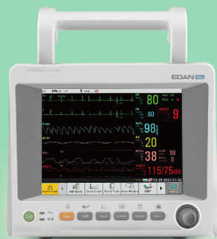
iM50 Moniteur de patient